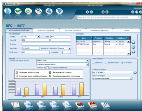
Analyse graphique des dépenses par tiers et gestion des contacts