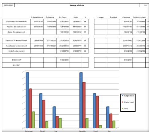
Export des éditions en HTML-PDF-MAIL